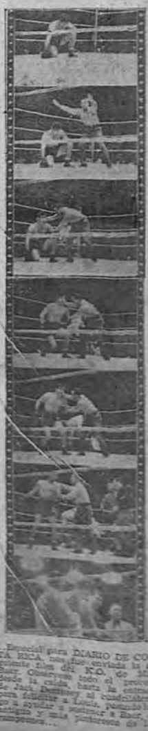
Film del "K. O." de Baer

LOS TREMENDOS DAÑOS DE LOS HURACANES EN CUBA LA HABANA, 30.— Los últimos informes oficiales del ejército han anotado desde el sábado la isla de Cuba, indican que ha habido 29 muertos, cerca de cuatrocientos heridos y daños materiales por más de cuatro millones de dólares. Los afectados más afectados son Santa Clara y Camagüey. Observese todo el proceso de Jack Dempsey al consolarse de su victoria a Louis, campeón antiguo y más poderoso de Baer, el campeón de los tiempos de la guerra.